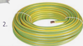
Bobines de câble de terre souple 6mm 2 et câble de terre rigide 16mm 2 (2.)