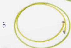
Câbles de terre avec cosses 700mm et 1500mm pour la liaison des rails de fixation (3.)